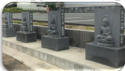
四国 88 箇所霊場各本尊像